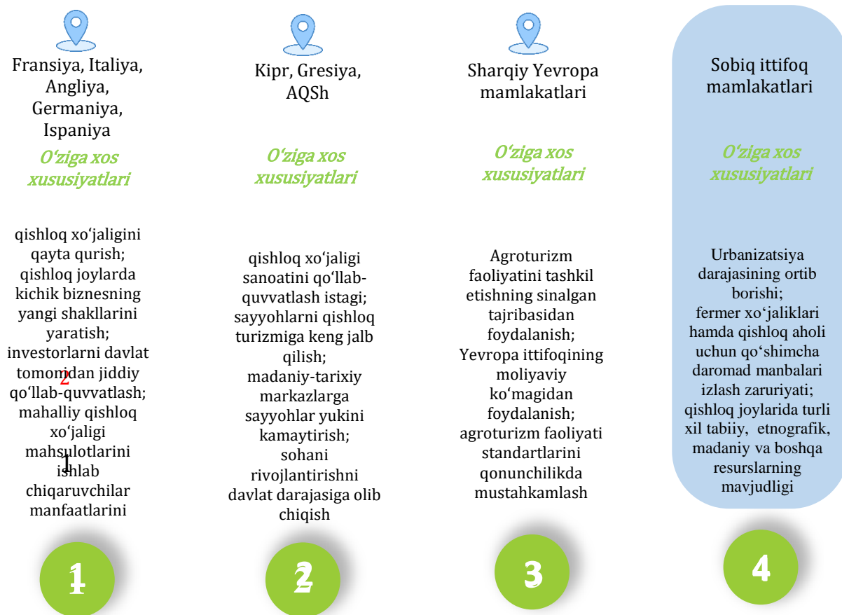
1-rasm. Agroturizm rivojining “4 to‘lqini” 1

Yevropada turli mamlakatlarning o‘ziga xos sharoitlari bilan bog‘liq holda bir-biridan sezilarli darajada farq qiluvchi turli maqsadlarga yo‘naltirilgan hamda turli muammolarni hal etishga qaratilgan bir necha agroturizm modellari mavjud. Ko‘pgina Yevropa mamlakatlarida agroturizm milliy turizm sanoatini rivojlantirishning yetakchi yo‘nalishlaridan biri sifatida tan olinib, turizmni rivojlantirishning milliy kopsepsiyalarida o‘z ifodasini topgan.